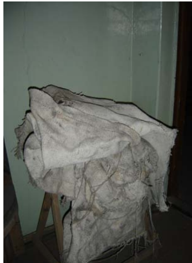
1.attēls. Azbesta audums