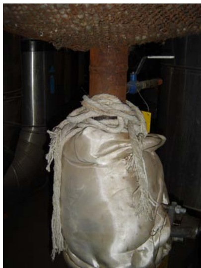
3.attēls. Azbesta auklas