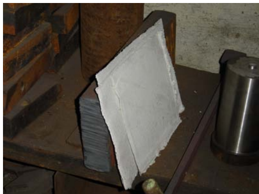
4.attēls. Azbesta kartons