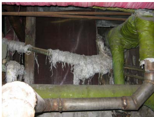
5.attēls. Bojāta azbestu saturoša siltumizolācija