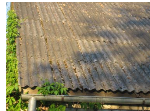
7.attēls. Azbestu saturošs šiferis kā jumta segums