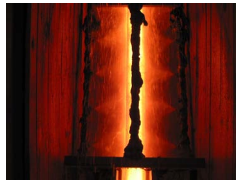
6.attēls. Azbests kā ugunsizturīgs materiāls