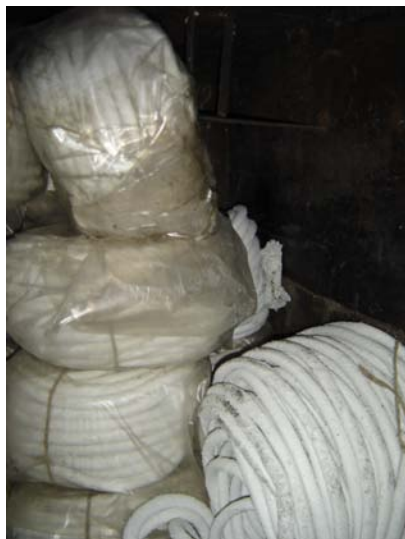
2.attēls. Azbesta šņores